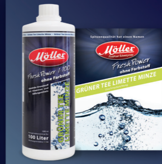
Grüner Tee Limette Minze